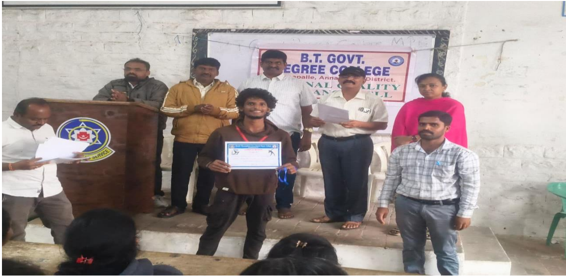
PHOTO EVIDENCES - NEWS PAPER CLIPPINGS