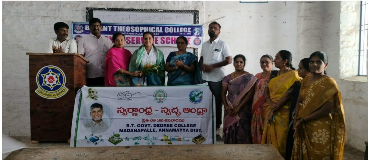
Honouring the guest