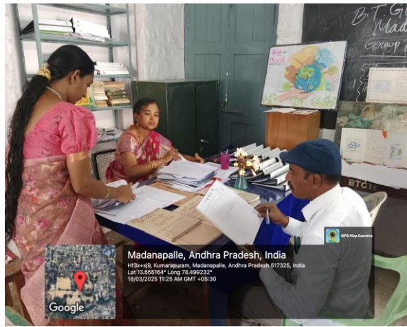
At Botany Department