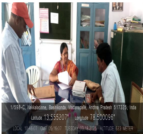
At Economics Department