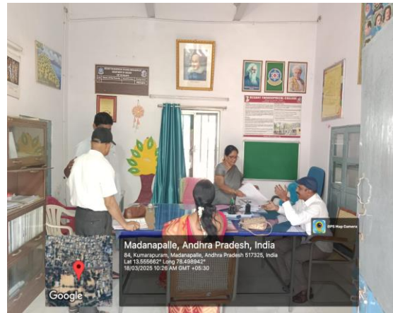
At English Department